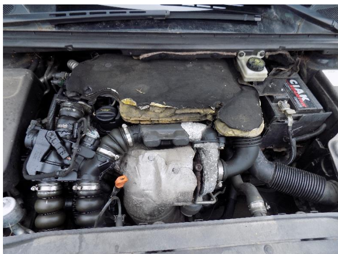
3. Peugeot 307 – motor