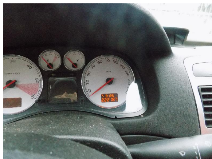
4. Peugeot 307 – kilometar sat