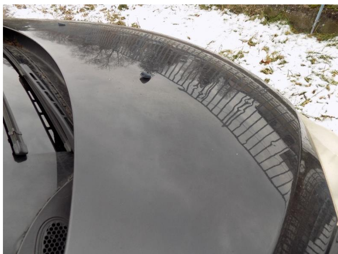
2. Peugeot 307 – oštećenje poklopca motora