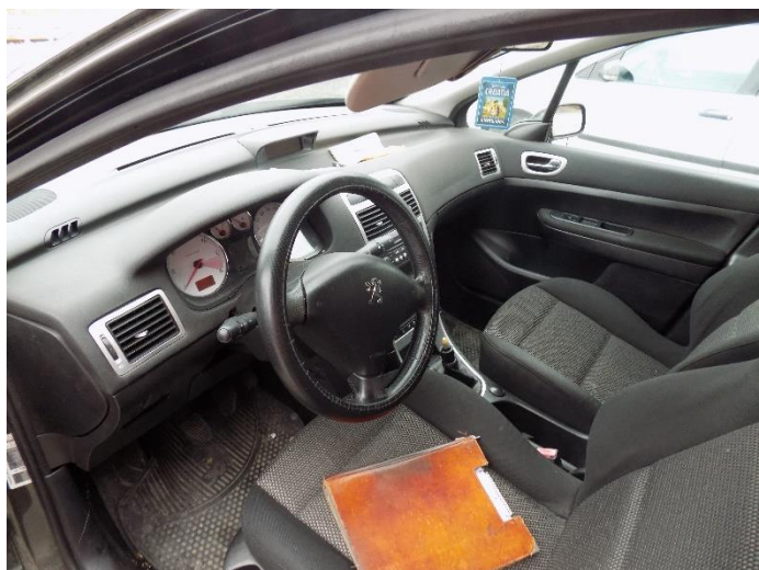
1. Peugeot 307 – unutrašnjost vozila