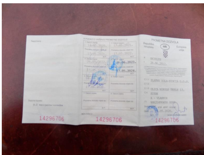
5. Peugeot 307 – prometna dozvola